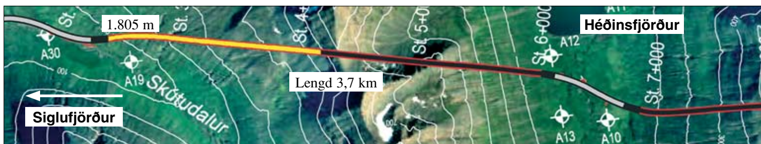
Staða framkvæmda við Héðinsfjarðargöng 18. júní 2007. Búið er að sprengja 1.805 m í Siglufirði og 1.202 m í Ólafsfirði.